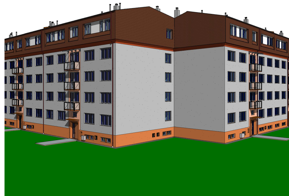
3 3D pohled 1_SS