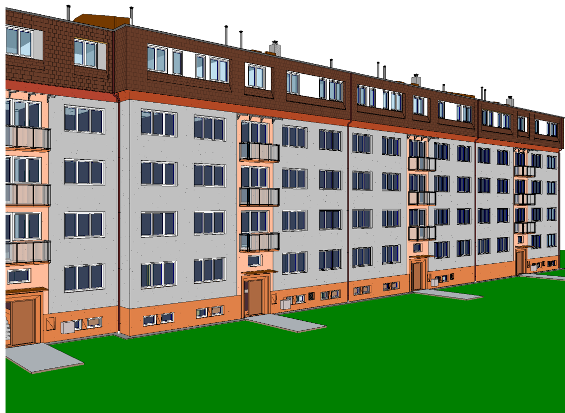
4 3D pohled 3_SS