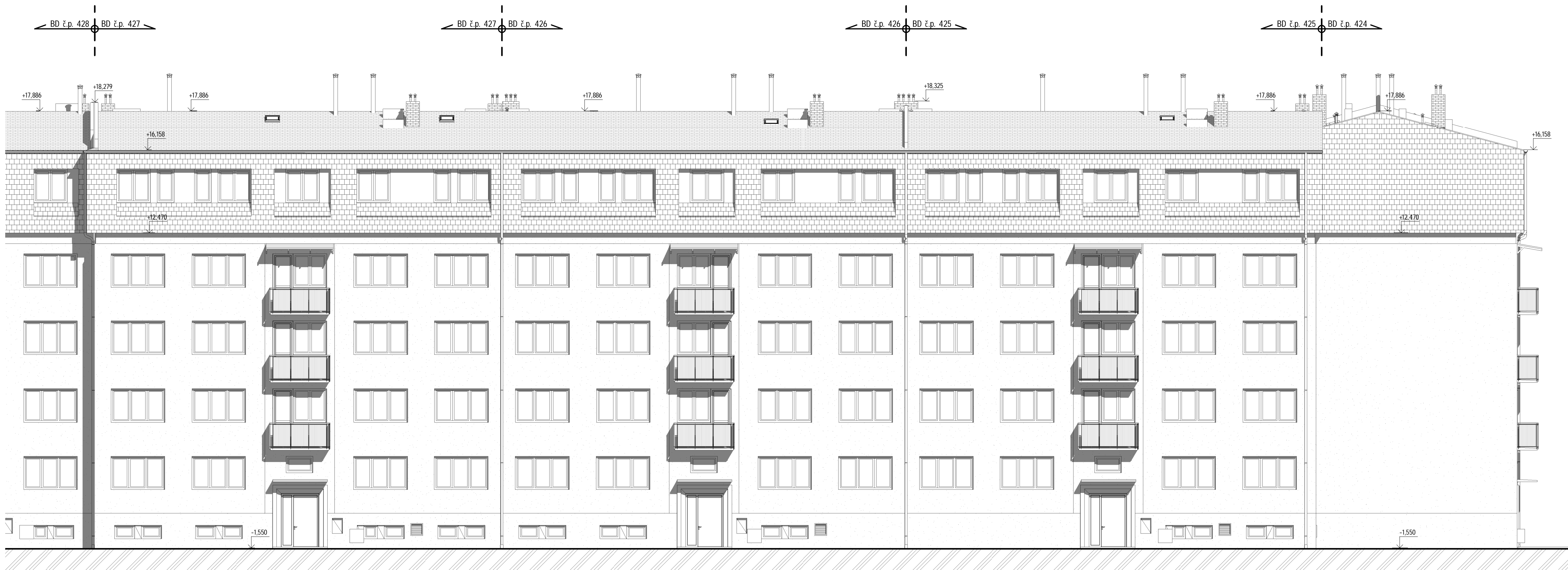
1 Pohled přední 1 : 100